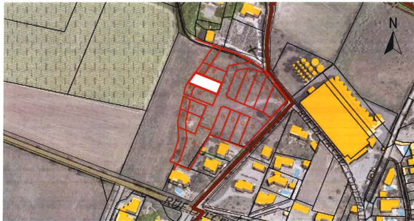
Plan de situation 1/2500